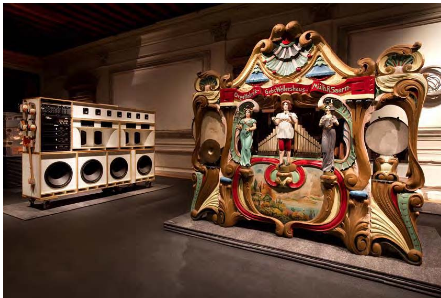
Immagini della mostra 'Art or Sound', Fondazione Prada, Ca' Corner della Regina, Venezia, 7 giugno – 3 novembre 2014.