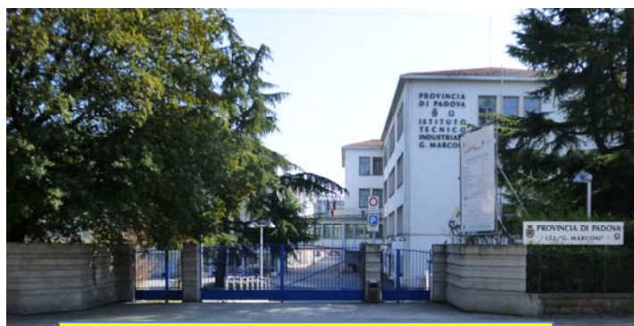
INGRESSO AL PARCHEGGIO

( parcheggio annesso o in via Carducci )