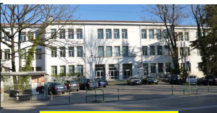
SEDE DEL CONVEGNO