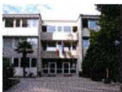
I.T.C.S. A. Pasoli